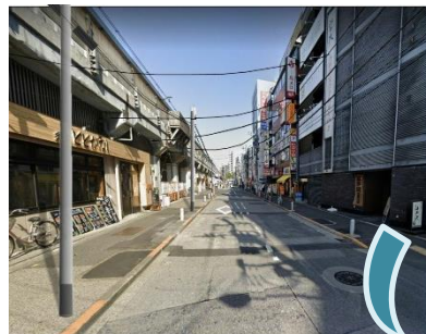
沿道住民や電線事業者との アツい調整による無電柱化 で青空を取り戻した両国駅 周辺