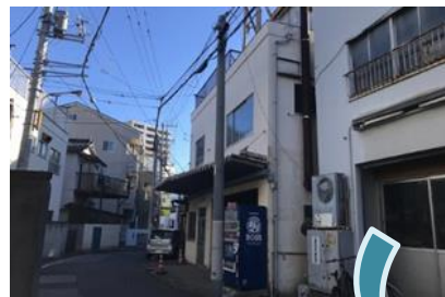
密集事業による広場整備