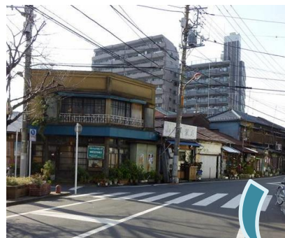
防災街区整備事業による 共同建替え