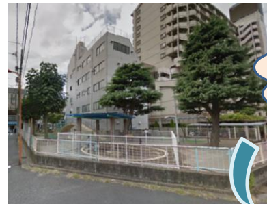
既製品の遊具では物足りない。 自ら設計したオリジナル遊具 で児童遊園をリニューアル