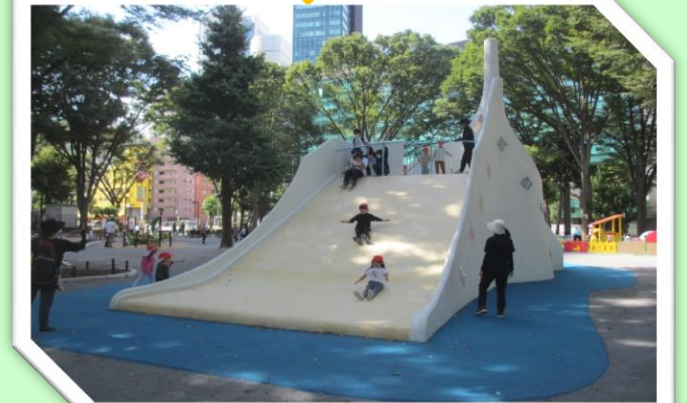
令和4年10月 に完成した 「ちびっこ広場」