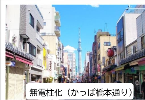
無電柱化（かっぱ橋本通り）

都市防災機能の強化、安全で快適な歩行空間の確保、良好な都市景観の創出を目的として、区道の無電柱化を進めています！