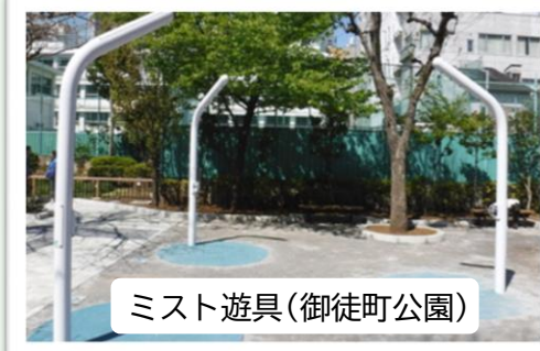
ミスト遊具（御徒町公園）

また、「水遊びができる公園を増やしてほしい」という声に応えるためミスト遊具を設置したり、公園利用者へのアンケート調査等を実施するなど区民のニーズに応える公園整備を進めています！