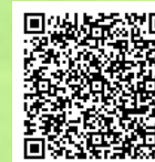
荻外荘復原・整備プロジェクト

築地本願寺等を手掛けた、日本を代表する建築家 伊東忠太設計による現存する 4 つの邸宅建築の一つである「荻外荘」には、その半分が豊島区内に移築されていたという経緯があります。「荻外荘」の復原・整備最大の目玉は、その移築部分を解体し、部材を杉並区荻窪に運搬、当初建っていた正にその位置に再移築したうえで、「古色塗り」等により近衛居住当時の雰囲気さえも再現する、という点です。このほば前例のない取組に職員として参加してみませんか？