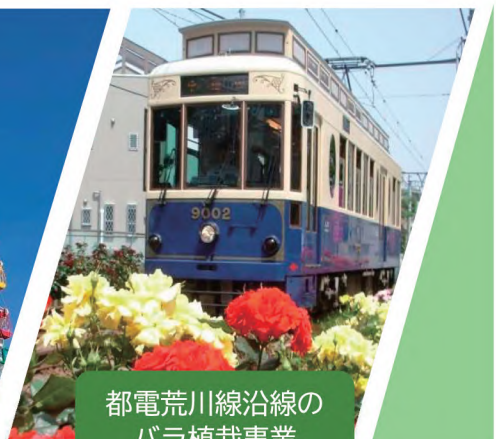
都電荒川線沿線の バラ植栽事業

令和4年4月に、都内唯一の区営遊園地「あらかわ遊園」がリニューアルオープンしました。富士山も見える高さ40mの観覧車や、夜間のイルミネーションなど、大人から子どもまで楽しめる遊園地として運営しています。