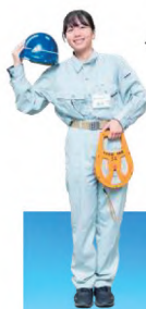
1年目でも任せて もらえる仕事が多い！

23区中3番目の面積を誇る足立区は、公園や学校、保育園もたくさん。 現場の数が多い分、若手職員のうちからチャレンジできる環境に溢れています！