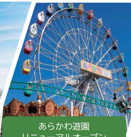
あらかわ遊園 リニューアルオープン

JR 山手線・京浜東北線、東京メトロ、日暮里・舎人ライナーが運行する西日暮里駅の駅前で、タワーマンションや商業施設、ホール、区の文化交流施設を整備し、“文化交流拠点”として地域の個性を生かした再開発を推進しています。