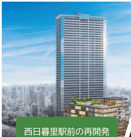
西日暮里駅前の再開発

JR 山手線・京浜東北線、東京メトロ、日暮里・舎人ライナーが運行する西日暮里駅の駅前で、タワーマンションや商業施設、ホール、区の文化交流施設を整備し、“文化交流拠点”として地域の個性を生かした再開発を推進しています。