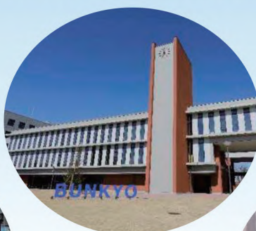
区内6つ目 大学オープン！