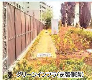
グリーンインフラ(芝張側溝)