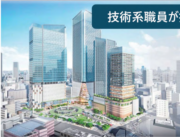
市街地再開発事業（池袋駅西口地区）