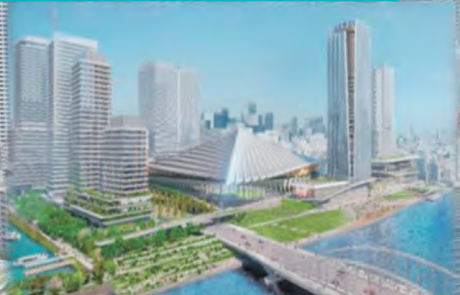
築地まちづくり株式会社作成

食文化の拠点として、多くの人を惹きつけてきた「築地」において、築地市場跡地開発の事業が進められています。地元区として、地域と共に良好なまちづくりの推進に取り組んでいます。