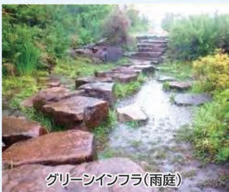
グリーンインフラ(雨庭)