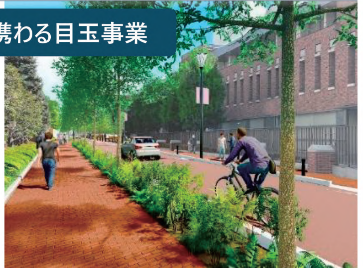
景観道路工事（立教大学12号館付近）