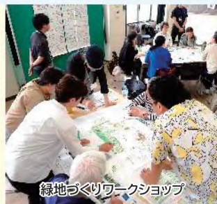
緑地づくりワークショップ