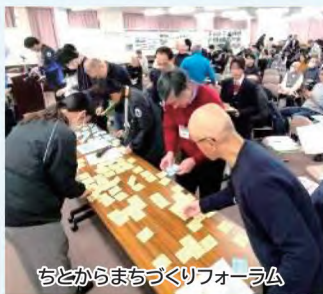
ちとからまちづくりフォーラム